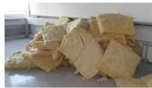
Künstliche Mineralfasern (KMF)