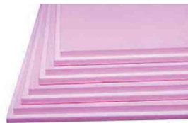
Extrudiertes Polystyrol (XPS)