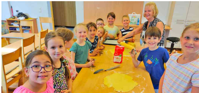
Die erste Klasse stellte die Aufgabe: Gemeinsam Backen