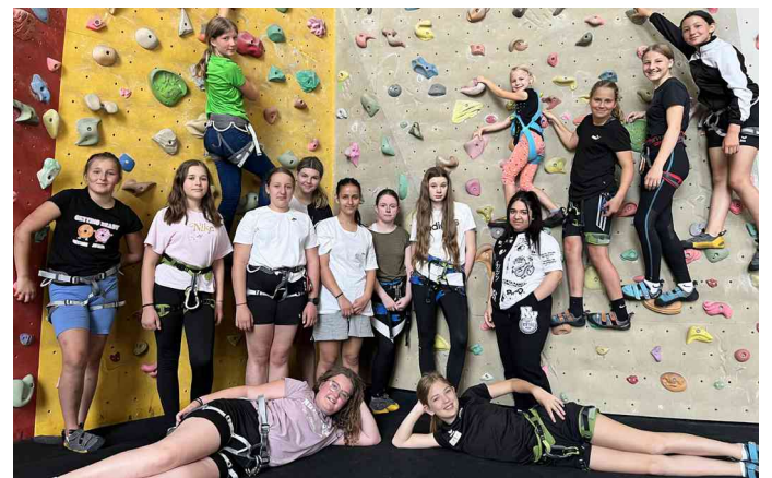
Aktionstag: Klettern in Weinburg